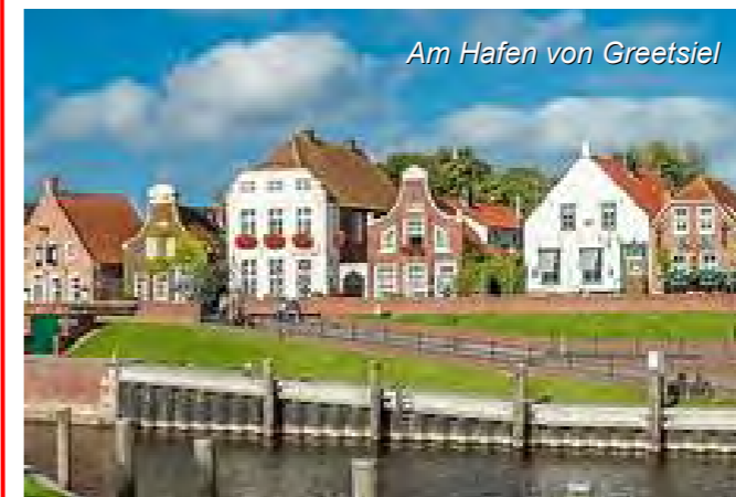
Am Hafen von Greetsiel

Bei Anmeldung ist eine Anzahlung in Höhe von 50,- € pro Person innerhalb von 14 Tagen fällig.