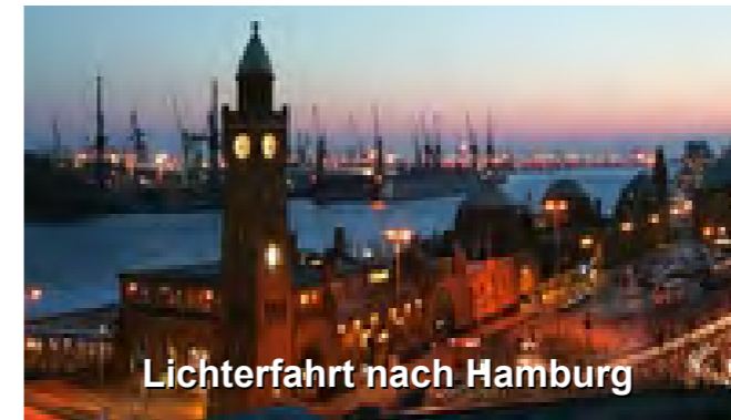
Lichterfahrt nach Hamburg

Auch 2022 planen wir die traditionelle Lichterfahrt durch das weihnachtliche Hamburg. Die Fahrt endet am Hansa-Theater, wo ein magischer Varieté-Abend im plüschigen 50er-Jahre-Ambiente uns erwartet.