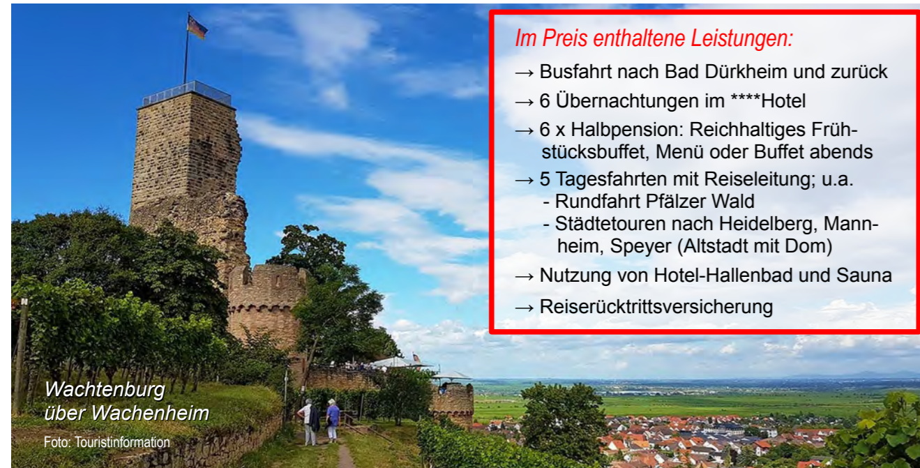
Wachtenburg über Wachenheim

Anmeldung + Kartenverkauf bis: 9. Juli 2022